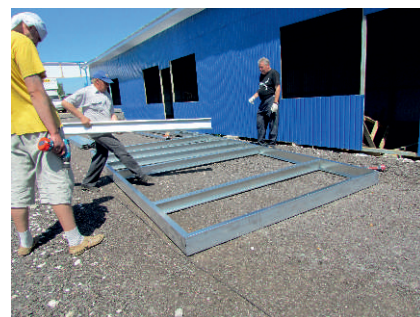
Фото монтажа Парковка однорядная “ПИТ-2”